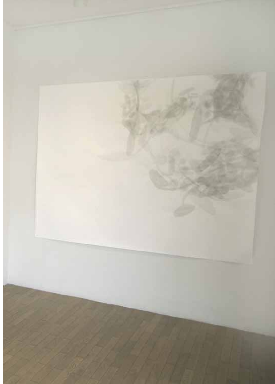
somewhere else 100 x150mm basel. 2008