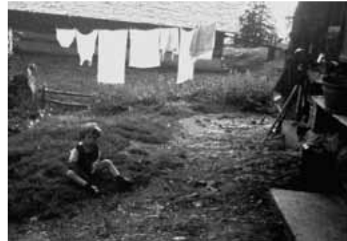
ella little 100x150mm maria rickenbach. engelberg 1967/2009