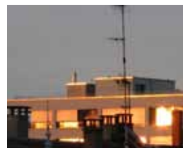
early morning 200x250mm basel. 2000