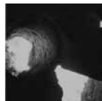
ruine 150x150mm cervetri. latio italy 1999