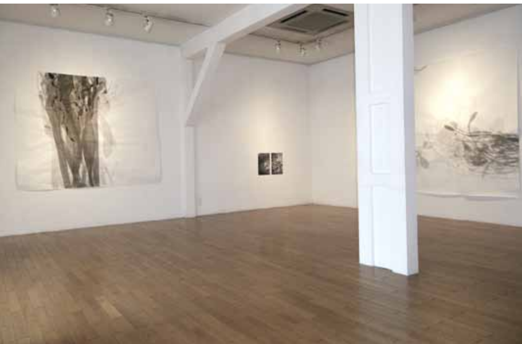
paperwork n°12 1500x1800mm. ink on paper. 2008