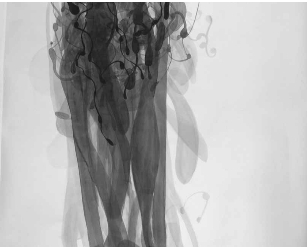
paperwork n°12 1500x1800mm. ink on paper. 2008