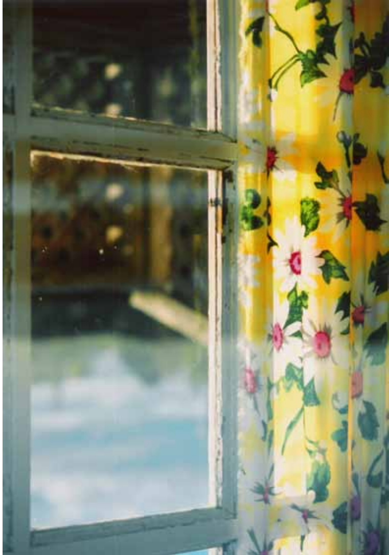
studio 380x250mm st. jean port jolie. canada. 2000