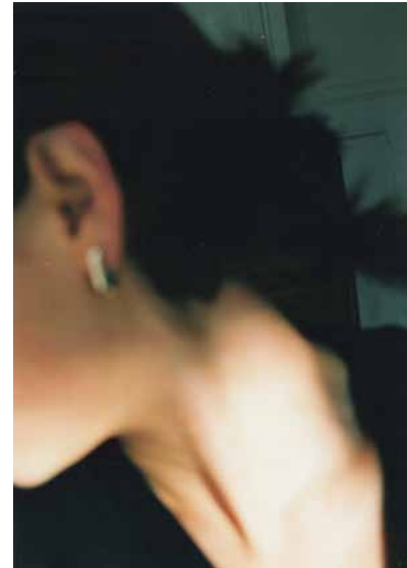
roots. 190x130mm chinatown. newyork. 2000